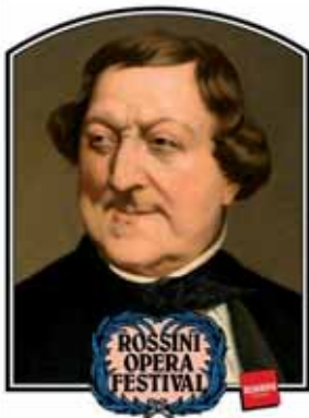
Pesaro, 9-22 agosto 2010

• Fondazione 'Rossini Opera Festival' - 32 a edizione 'Rossini Opera Festival'