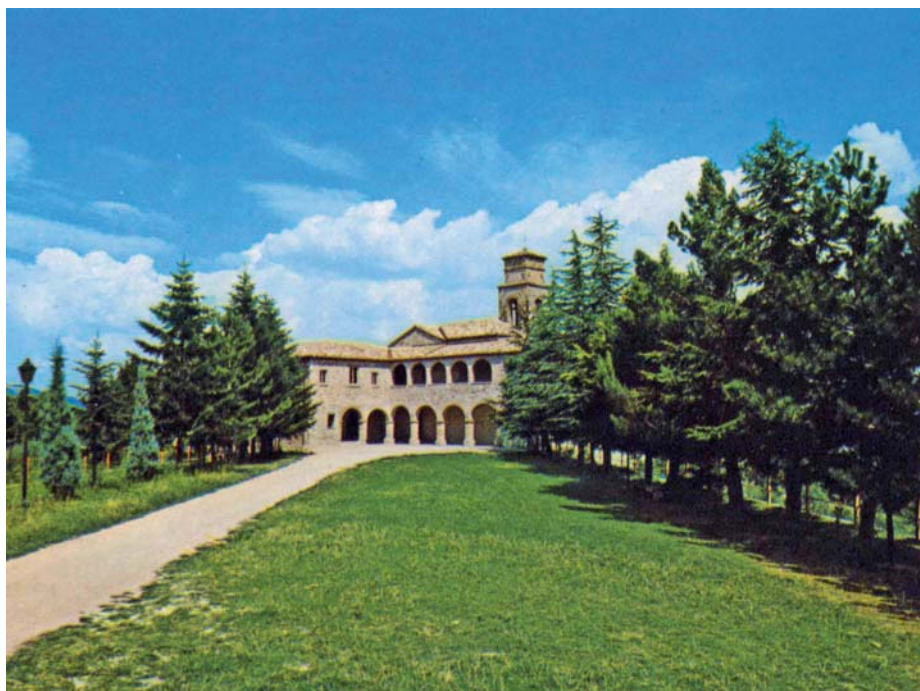
Convento di Montefiorentino, sede del Premio Frontino

• Accademia Raffaello in Urbino: contributo per attività artistico-culturale