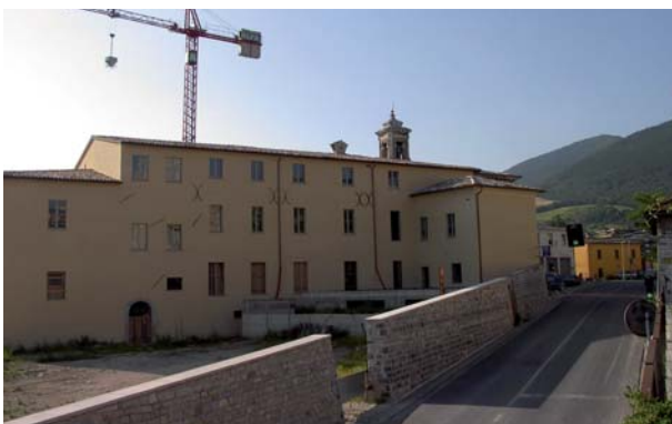
Convento S. Chiara

• Comune di Apecchio: progetto pluriennale: interventi di messa in sicurezza ed acquisto arredi didattici plessi scolastici di Apecchio e Serravalle di Carda - I tranche contributo